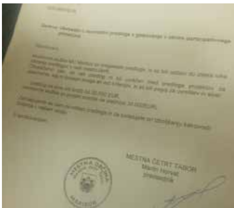
Iz zavrnitve predloga Taborčana se ne da razbrati niti katerega izmed predlogov so zavrnili.