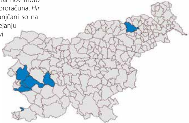
Občine, ki so se poskusile v participatornem proračunu: Ankaran, Logatec, Ajdovščina, Maribor, Komen, Nova Gorica.

Naj nam slavni ustvarjalec ne zameri adaptacije verzov, a žal bi refren zlahka postal nov moto pilotne uvedbe participatornega proračuna. Hir aj kam, hir aj go , Radvanje. Radvanjčani so na področju participacije pri razporejanju občinskih sredstev v marsičem prvi in dogajanje v SČS Radvanje je oralo ledino pri uvajanju slovenskega modela participatornega proračuna. Nastal je Participatorni proračun: kratka navodila za izvajanje 1 , priročnik s ciljem izobraževanja o vseh fazah PP, ki ni le prevod tujih del, ampak v svojih praktičnih priporočilih sloni na izkušnjah s terena: Radvanja. Zamisel je začela zanimati tudi župane drugod po Sloveniji, ki so se obračali na snovalce slovenske različice participatornega proračuna s svojimi vprašanji o izvedbi. Sčasoma so model posnemale, bolj ali manj zvesto, še nekatere druge občine - sprva Ajdovščina, nato Komen, nazadnje še Nova Gorica in Logatec. Ankaran je pri načinu izvedbe najbolj svoboden in ne sledi strogim fazam participatornega proračuna kot takega, vendar jemljejo odločanje občanov o razporejanju občinskih sredstev zelo resno in