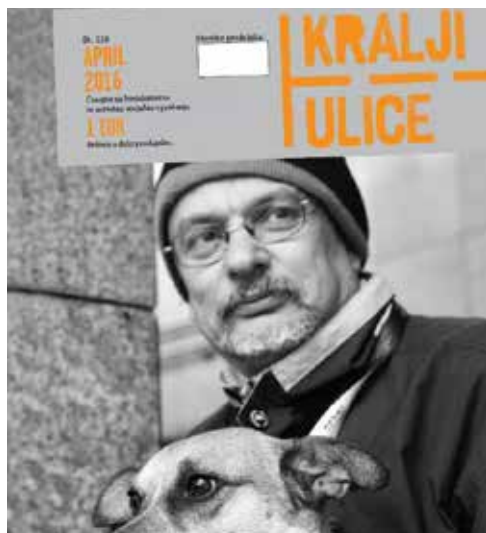
V Sloveniji je brezdomcev že več kot 3000