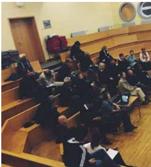
SČS Nova vas