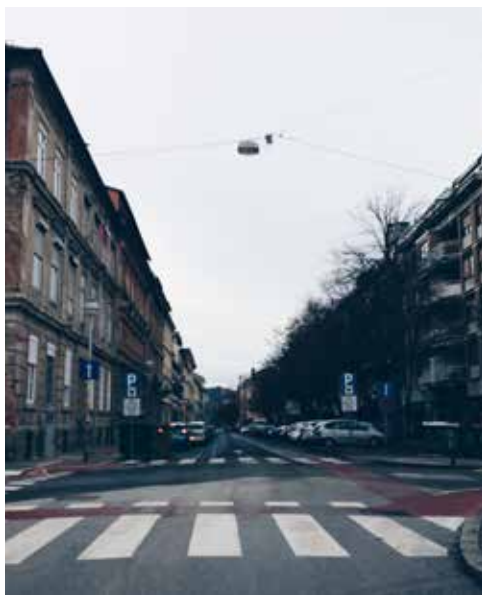
MČ Ivan Cankar