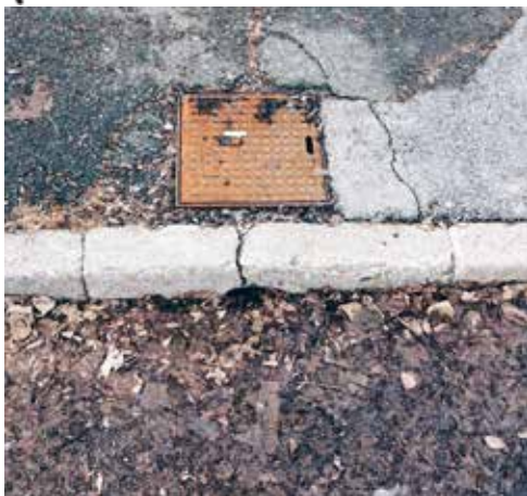
Stanje infrastrukture v KS Pekre

Razprava o participatornem proračunu, v kate-