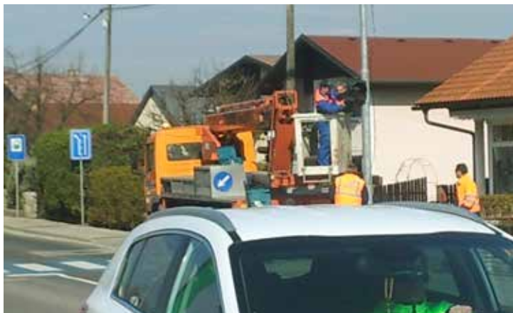
Levo: Ureditev prehoda za pešce na Streliški cesti pri trgovini TUŠ - zaradi potrebe po večji vidnosti in varnosti pešcev je to postal projekt PP, ki so ga v Radvanju tudi izglasovali.