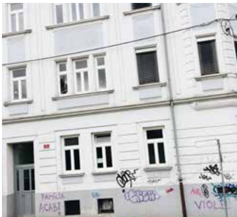
Pografitirana fasada v MČ Magdalena