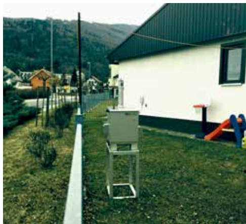
Merilna naprava za kvaliteto zraka v MČ Radvanje

Glavna ovira za druženje krajanov_k in skupnostne aktivnosti na najrazličnejših področjih v kraju predstavlja prostorski problem, o katerem se na zboru govori že nekaj časa, nanj pa nenehno opozarjajo tako svet MČ kot tudi odgovorne v mestni občini. A udeleženci_ke imajo občutek, da je županu, mestnemu svetu in mestni upravi pomembno vse drugo, le interesi in potrebe ljudi v mestu ne.