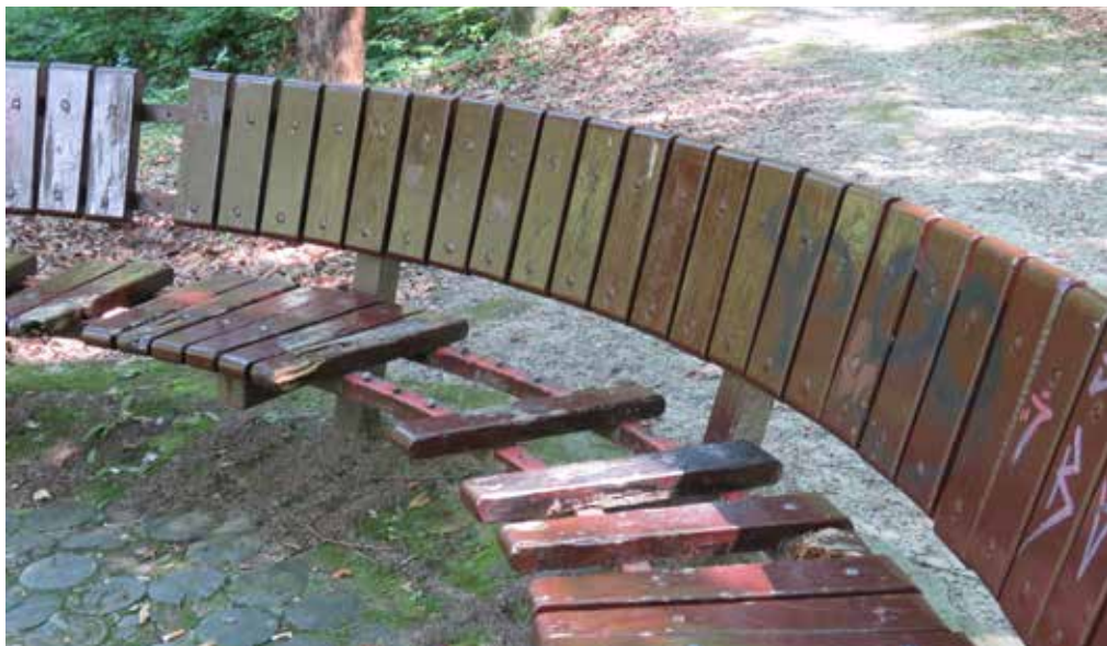
Poškodovana klop pri 3. ribniku