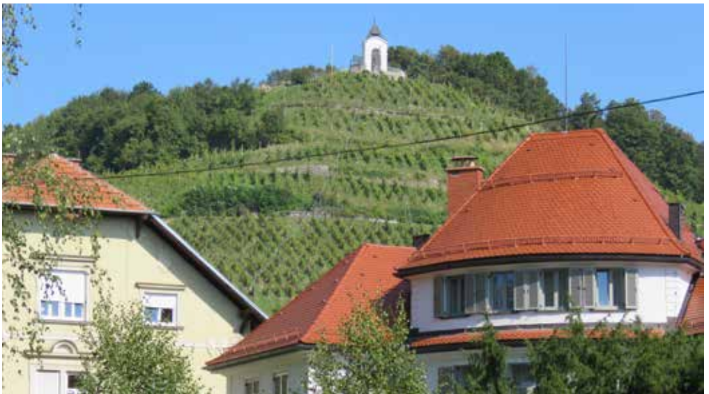
Pogled na Piramido iz mestnega parka