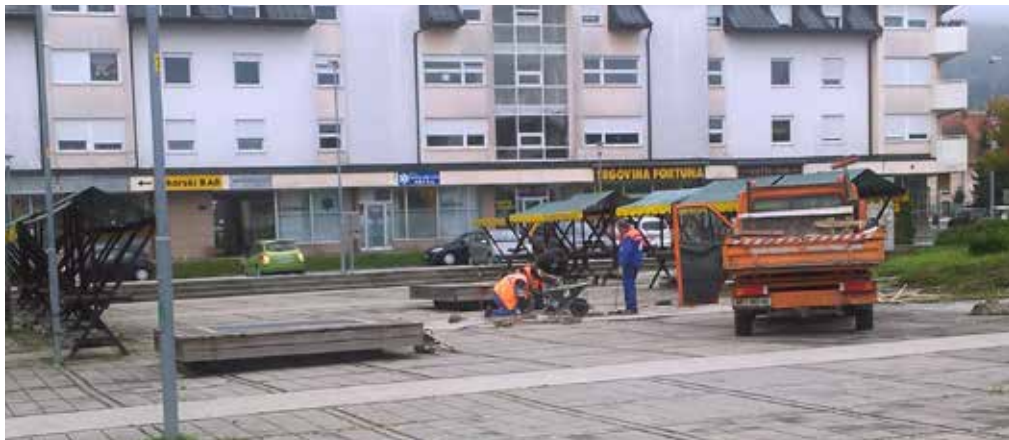
Zgoraj: Izvajanje na glasovanju prvouvrščenega projekta, sanacije Radvanjskega trga