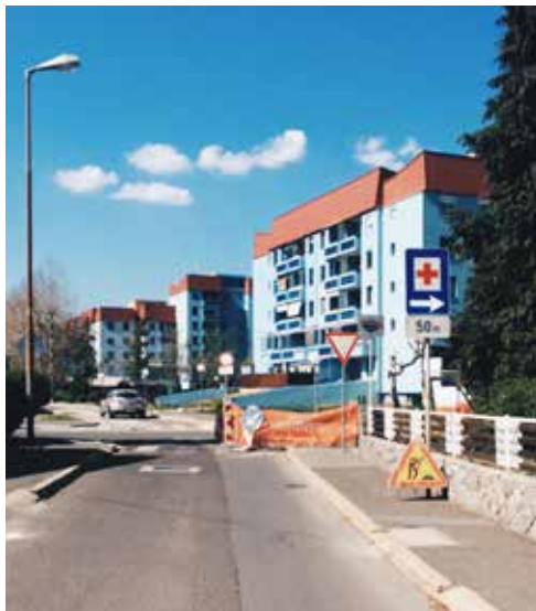
Zaprta cesta v MČ Nova vas