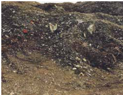
Nelegalno nasuta zemljina v Pekrah

Tokrat so se na zboru SKS Pekre udeleženci_ke najprej na kratko seznanili_e s poročilom Inšpektorata RS za okolje in prostor v zvezi z ugotavljanjem postopkov, izvedenih na lokacijah spornega nasipa. Poročilo je bilo podano na zahtevo Ministrstva za okolje in prostor, v njem pa je moč prebrati ugotovitev, da je bilo nasutje zemljine v skladu z