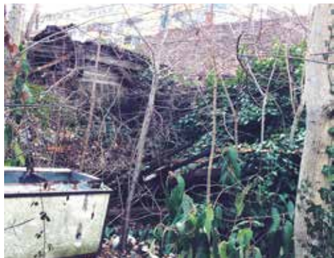
Posest ob Magdalenskem parku