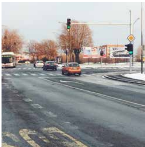
Promet v MČ Pobrežje

prebivalcev_k v soodločanje sedaj že prehitel vajo male in malo večje občine, je očitno, da bo potrebno skupaj razmisliti, kako političnim odločevalcem_kam dopovedati, da smo prebivalci_ke tisti_e, ki najbolj vemo, kaj v svojem bivalnem okolju potrebujemo in pogrešamo. In seveda skupaj najti način, kako zavlačevanju pri kreiranju soodločevalskega okolja v mestu narediti konec. V lanskem letu bi moral biti PP izveden v šestih MČ in KS, le-tos že po vsej občini, pa postopki in sredstva tudi letos niso opredeljeni niti za širitev. Širi se tudi komunikacijska kampanja, v kateri se ljudje prepričuje, da jih, razen glasovanja na volitvah, demokratični postopki ne vključujejo.