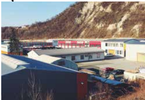
Območje nekdanje Svile, sedaj baza Marproma in nekaterih drugih podjetij

Vse odtlej so prebivalci_ke ob cesti k Dravi drugorazredni državljanke_ke, ki na prioritetni listi takšnih in drugačnih domnevnih pravic zasebnega kapitala enostavno nimajo svojega mesta.