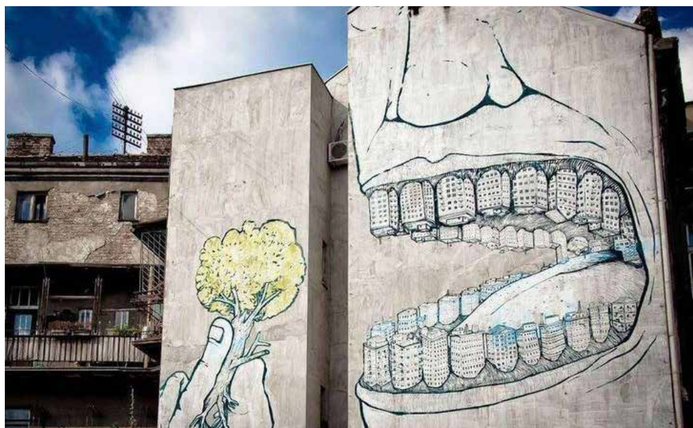
Mural v Beogradu

• Vabljeni, da na povezavi preberete celoten članek. http://www.deloindom.si/drevje-grmicevje/mestna-drevesa-nedopustno-je-drevesu-odvzeti-vec-kot-desetino-krosnje