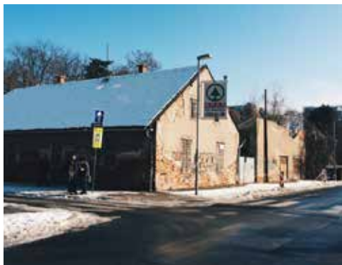
Jugozahodni kot Magdalenskega parka

Na zboru SČS Magdalena so udeleženke spregovorile o možnosti samoorganiziranja lastnega zbora. Idealno bi bilo, da bi zbori postali